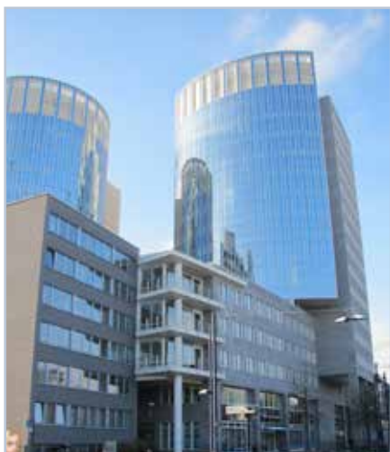
Das Bürogebäude vom Marktplatz kommend