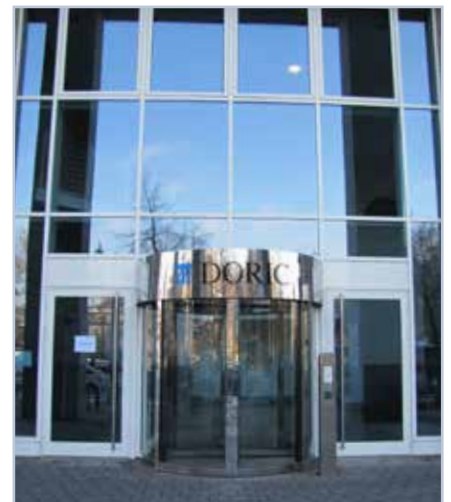
Besuchereingang | Doric GmbH Berliner Straße 116 | 63065 Offenbach am Main