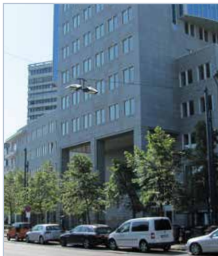
Das Bürogebäude vom Kaiserlei kommend