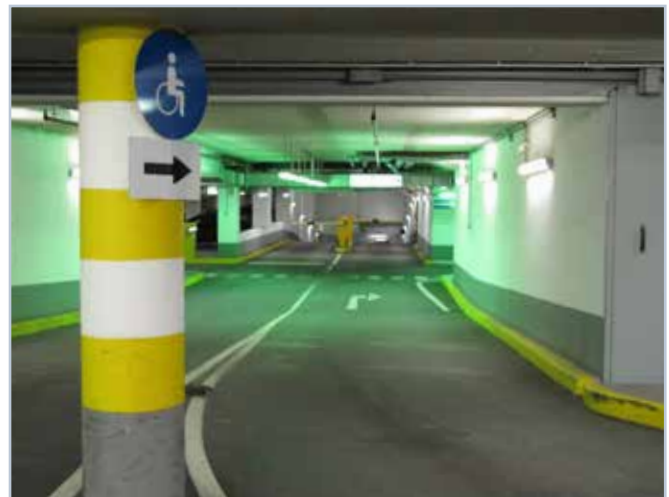
Parkhaus | Haus der Wirtschaft | Rechte Einfahrt