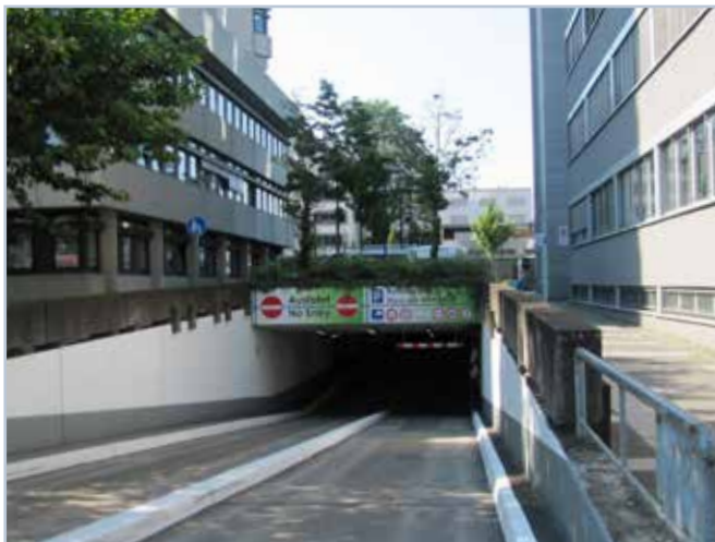
Parkhaus | Haus der Wirtschaft (bitte unbedingt rechte Einfahrt benutzen) Berliner Straße 112-116 | 63065 Offenbach am Main

Besucherparkplätze befinden sich im Parkhaus „Haus der Wirtschaft“ unmittelbar am Gebäude mit beschriftetem Zugang zu den Aufzügen. Bitte unbedingt die rechte Einfahrt des Parkhauses benutzen. Bitte ziehen Sie bei der Einfahrt ein reguläres Ticket. Für die Ausfahrt bekommen Sie ein Ausfahrtticket von uns.